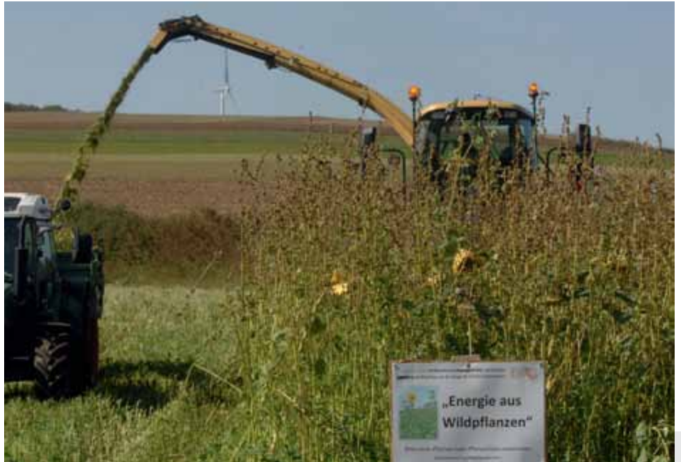
Bild 3: Die Ernte der wildartenreichen Bestände kann mit praxisüblicher Technik erfolgen.

Die ersten Ergebnisse bestätigen die Leistungsfähigkeit des Anbausystems, insbesondere wenn der im Vergleich zum Maisanbau wesentlich geringere Produktionsaufwand berücksichtigt wird. Eine abschließende ökonomische Bewertung kann jedoch erst erfolgen, wenn die Erträge für die nachfolgenden Standjahre vorliegen. Besondere wirtschaftliche Vorteile im Gegensatz zum Maisanbau sind insbesondere auf sehr feuchten oder sehr trockenen Standorten oder bei ho-